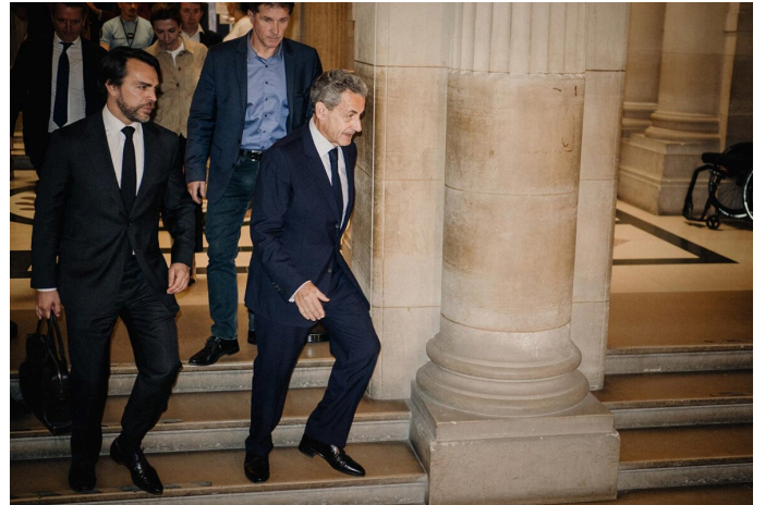
Nicolas Sarkozy quittant le tribunal de Paris, le 29 avril 2026.