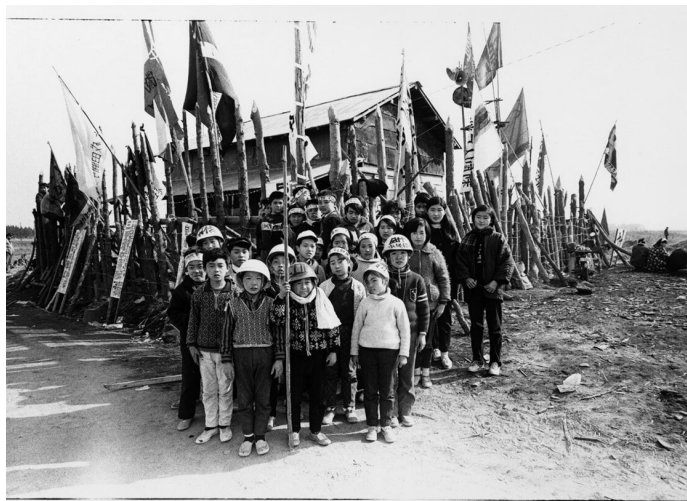
Unité de résistance des enfants, série Sanrizuka, Narita (département de Chiba), 1970.

Kazuo Kitai commence à se faire un nom, mais il doute. « Il y avait du mouvement et j'avais l'impression que je me contentais simplement de pointer ma caméra et de filmer. Je me disais que ça risquait de donner des images sans véritable initiative en tant que photographe. Alors, après quatre ou cinq ans, j'ai commencé à réfléchir à l'idée de photographe quelque chose de différent », raconte-t-il.