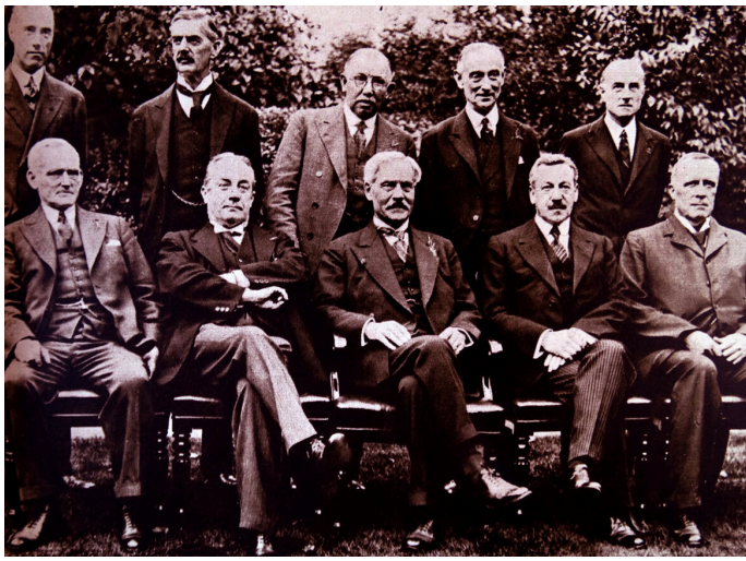
Le gouvernement national de Ramsay MacDonald en Grande-Bretagne, 1931. Assis, de gauche à droite : Philip Snowden, Stanley Baldwin, Ramsay MacDonald, lord Herbert Samuel, John Sankey ; debout, de gauche à droite : Philip Cunliffe-Lister, Neville Chamberlain, Thomas Reading, Samuel Hoare.